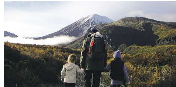
Pro Stázku a Amálku byl život na Zélandu velké dobrodružství

„Nejtěžší jsem to nakonec měla já, protože jsem byla už druhým rokem spokojená v práci a přede mnou se otvíraly zajímavé možnosti. Vzdala jsem se toho v zájmu svých nejbližších. A ukázalo se, že to byl velmi dobrý krok,“ říká psychoterapeutka Kateřina.