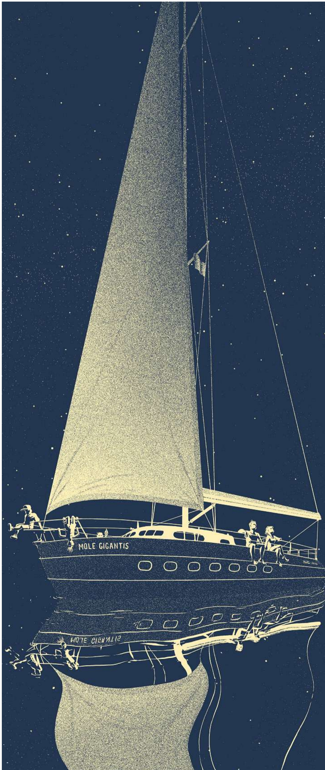
Když hvězdná obloha končí i začíná v oceánu...