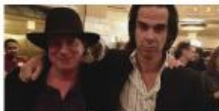
CON NICK CAVE