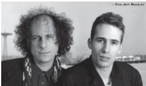
CON JEFF BUCKLEY

trumental, pero sentí que algunas canciones necesitaban un vocalista y empecé a buscar. No hubo un cantante fijo nunca... de hecho, Jeff Buckley estuvo entrando y saliendo durante un año, hasta que decidí cantar yo mismo y así me ahorra muchos problemas (Risas). Y de vez en cuando se lo proponía a algunos amigos, y uno de ellos, de los que aceptó, fue David. El mismo escribió la letra y me enseñó la canción, un Blues Rock agresivo que le siento como anillo al dedo. Ahora, decidí darle un 'loaded de cara' y estoy muy contento, está siendo la perfecta punta de lanza del álbum".