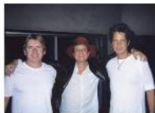
►► STEVE LILLYWHITE, GARY LUCAS & CHRIS CORNELL